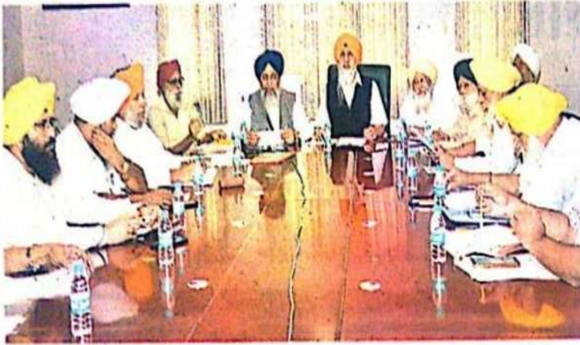
तख्त श्रीहरिमंदिर पटना साहिब में बैठक करते प्रबंधक समिति के सदस्य

तख्त श्रीहरिमंदिर में प्रबंधक समिति की बैठक में लिए गए कई निर्णय, सुरक्षा के रहे पुख्ता इंतजाम