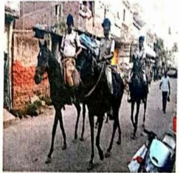
फ्लैग मार्च में शामिल घुड़सवार जवान।

को लेकर शहर में एक हजार अतिरिक्त पुलिस बल की तैनाती की गई है। ऐसे पूरे आसपास के क्षेत्र में 10 हजार पुलिस सुरक्षा में लगाए गए हैं। जिसमें रैफ, आईआरबी, जैप, सीआरपीएफ के अलावे ग्राउंड कंट्रोल बल