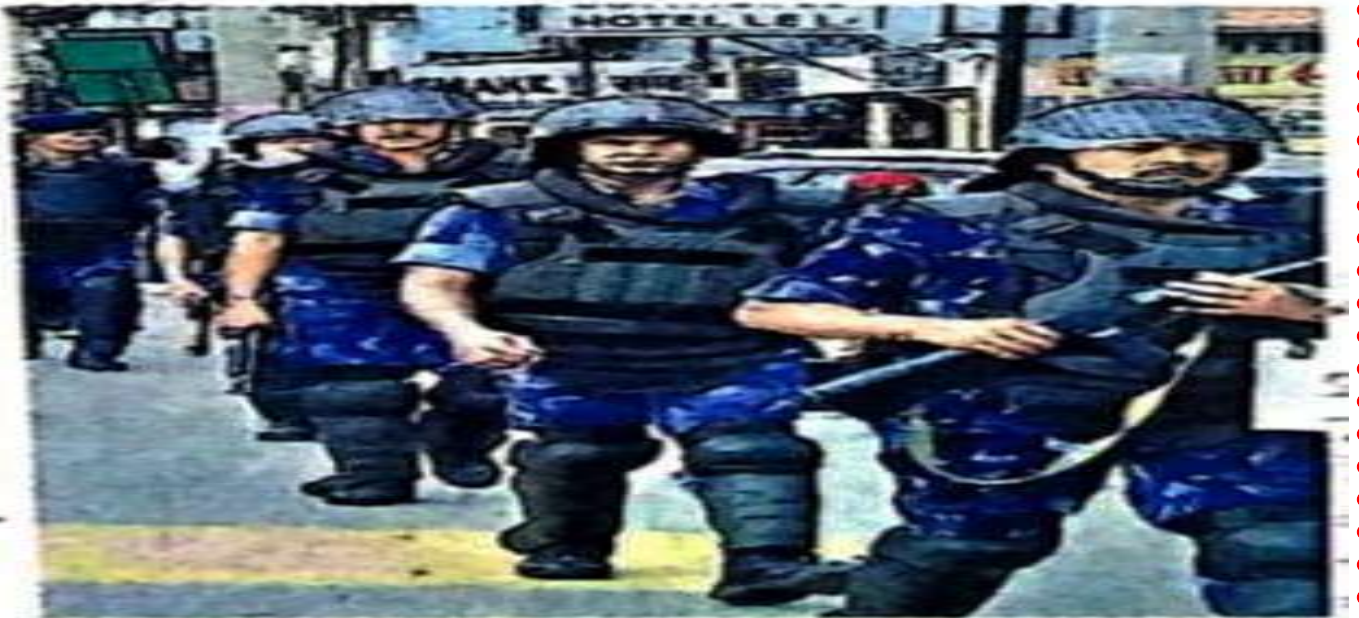
फ्लैग मार्च में शामिल जवान .