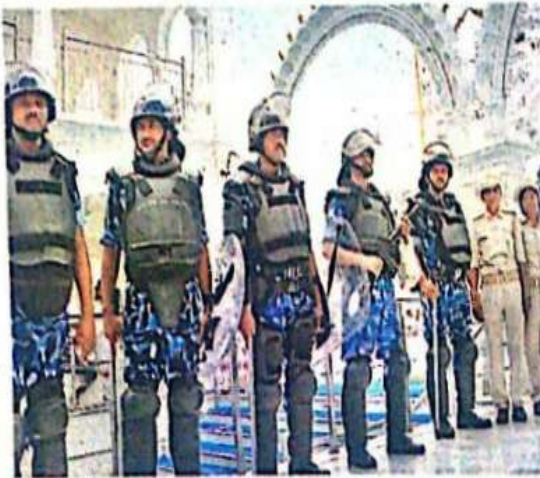
तख्त श्रीहरिमंदिर में जत्थेदार पद के चुनाव को लेकर तैनात सुरक्षाकर्मी