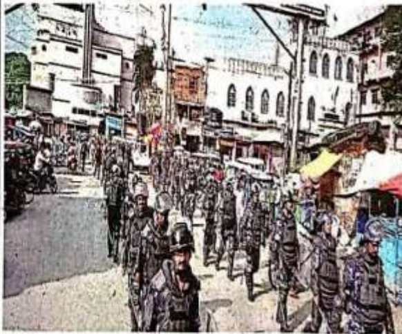
पौर गवर्न में शामिल जवान • जबरवा