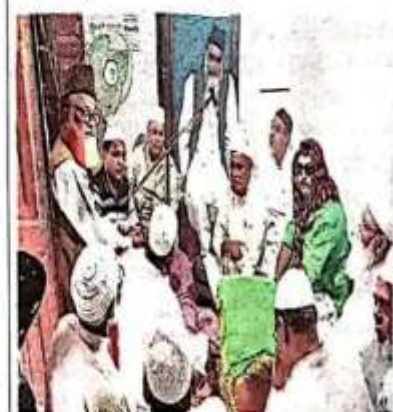
शोहरात क्वंता की मञ्चलिस में शामिल लोग • जबरवा