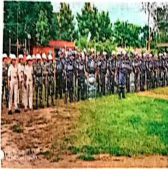
मुहर्रम को देखते हुए निकाले गए फ्लैग मार्च में शामिल जवान।