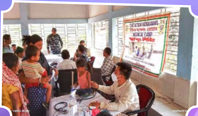
Organizing of Medical Camp at S. B. School, J. B. Para Gandacherra, Dhalai, Tripura.