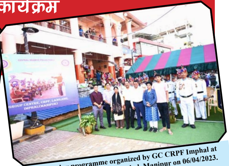
Band Display programme organized by GC CRPF Imphal at Ema Market (Paona Bazar) Imphal, Manipur on 06/04/2023.