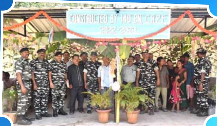
Construction of 01 No. Waiting Shed for Passengers at Mashurai Market Hadukulak, Dhalai, Tripura.