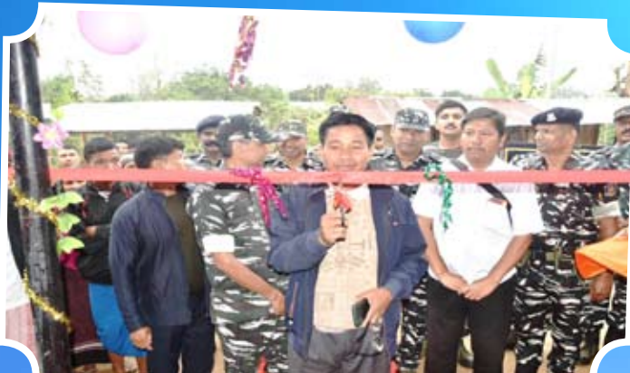
Construction of 01 No. Waiting Shed for Passengers at Krishanjay Para Boys Hostel, 19 Mile, Dhalai, Tripura.