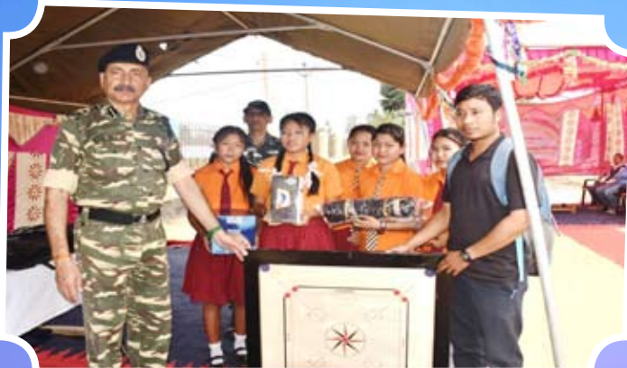
Distribution of Sports Items to Various School at 19 Mile Ganga Nagar, J.B. Para Ambassa, Dhalai, Tripura.