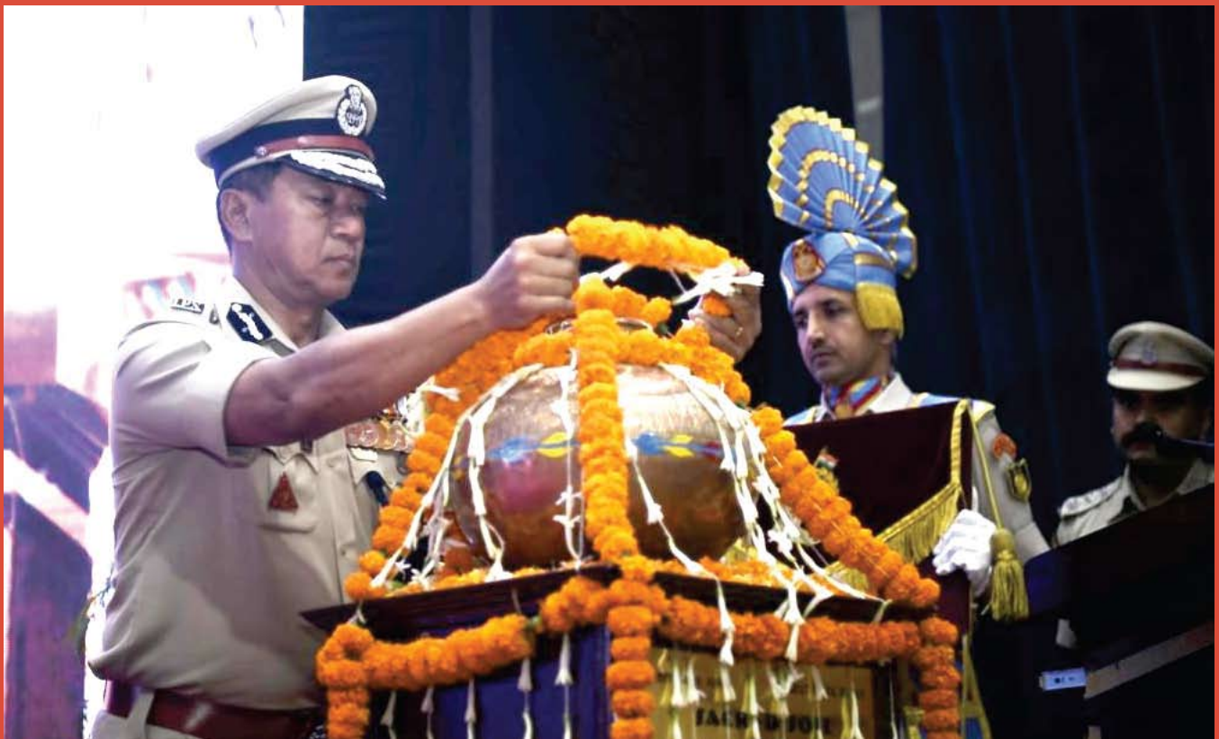
Dr. Sujoy Lal Thaosen, IPS, DG CRPF garlanded the urn filled with sacred soil from the battle ground of Sardar Post at the Bravery Day function.