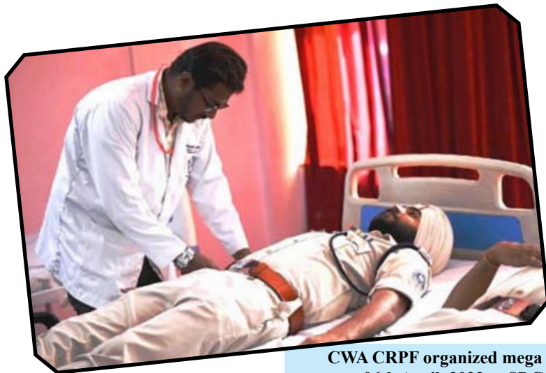
CWA CRPF organized mega blood donation camp on 06th April, 2023 at SDG campus, New Delhi.