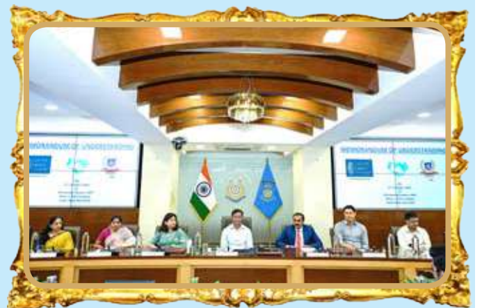
कावा, के.रि.पु.बल एवं सीएसआर एजुकेशनल ट्रस्ट के मध्य समझौता ज्ञापन।