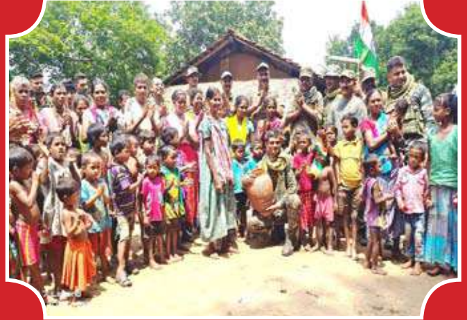
मेरी माटी मेरा देश कार्यक्रम के तहत ग्रामीणों के साथ 208 बटालियन के जवान ।