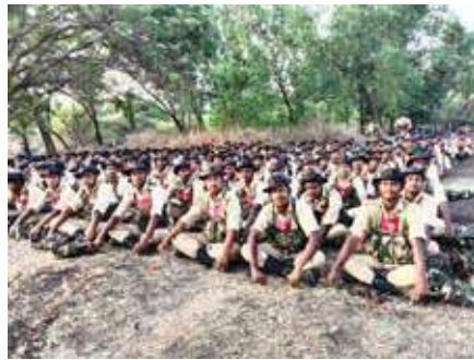
आर.टी.सी. लातूर में प्रशिक्षणरत बस्तरिया युवा।

अशांत क्षेत्रों में केन्द्रीय रिजर्व पुलिस बल आम नागरिकों का कौशल विकास कर उनको विकास की मुख्य धारा से जोड़ रहा है। बल के सदस्य आम नागरिकों को ड्राइविंग, सिलाई, कम्प्यूटर प्रशिक्षण तथा प्रतियोगी परीक्षाओं की तैयारी कराकर उनको रोजगार प्राप्ति में सक्रिय सहयोग दे रहे हैं। केन्द्रीय रिजर्व पुलिस बल द्वारा बस्तर के बीहड़ इलाकों से 400 युवाओं की भर्ती बस्तर के विकास व नक्सलवाद की समाप्ति में मील का पत्थर साबित हो रही है।