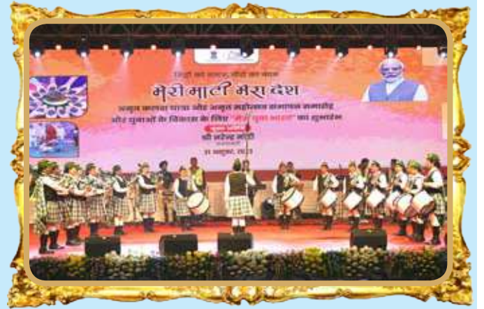
श्री नरेन्द्र मोदी, प्रधानमंत्री के दिशा-निर्देश में मेरी माटी मेरा देश अमृत कलश यात्रा, अमृत महोत्सव समापन समारोह और युवाओं के विकास के लिए "मेरा युवा भारत" का शुभारंभ।