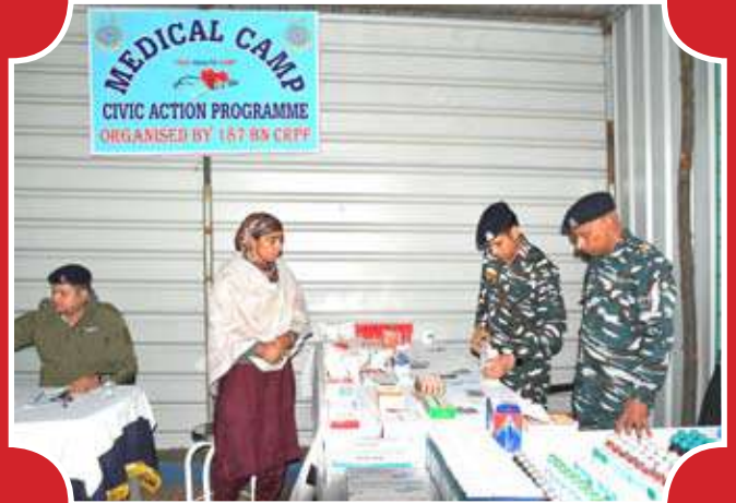
187 बटालियन द्वारा सिविक एक्शन प्रोग्राम के तहत ग्रामीणों की चिकित्सा जांच एवं दवाईयों का वितरण ।