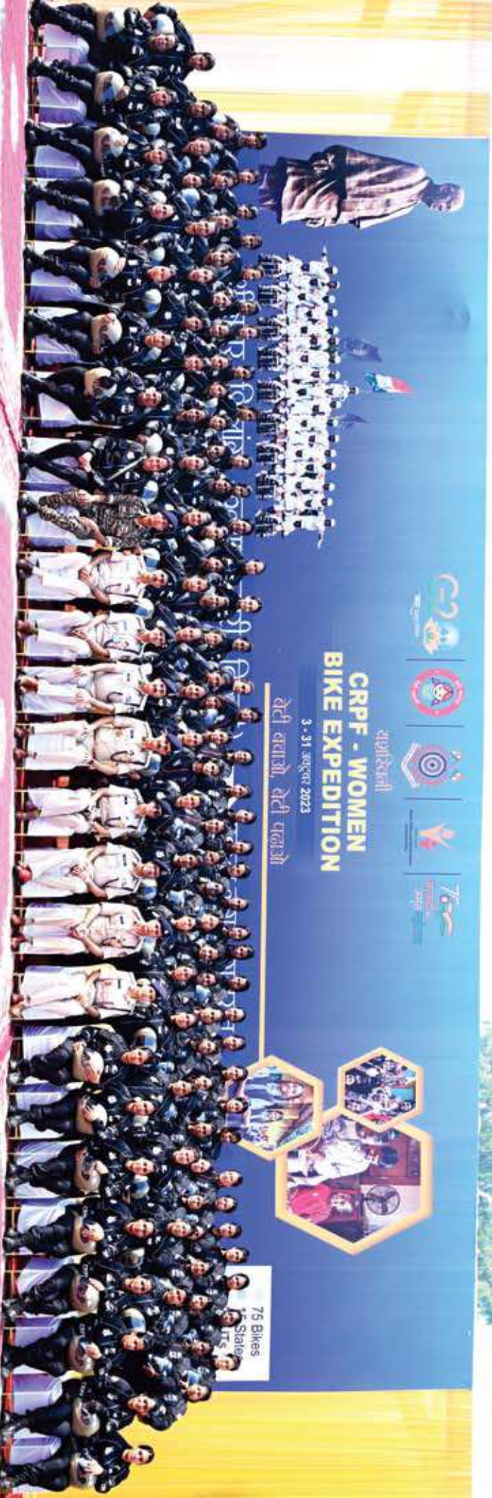
महानिदेशक के.रि.पु.बल एवं वरिष्ठ अधिकारीगण, 'यशस्विनी' महिला बाईकर्स प्रतिभागियों के साथ।