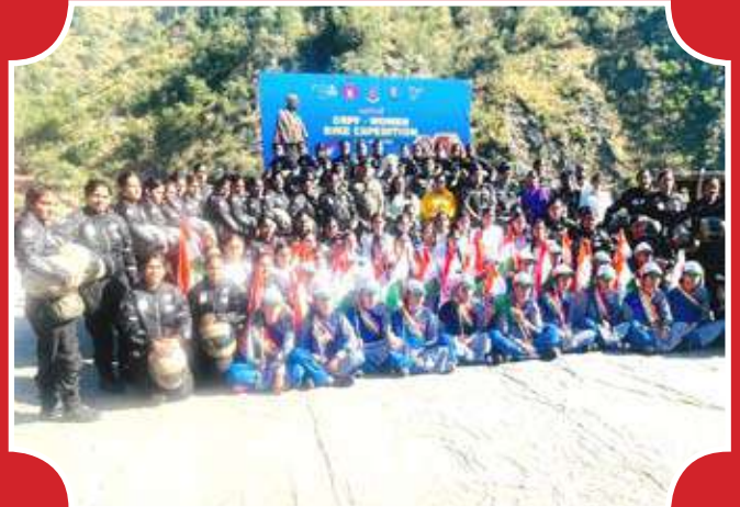
महिला बाईक अभियान की महिलाओं का स्वागत करते हुए 84 बटालियन सीआरपीएफ ।