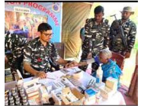
81 बटा. द्वारा पुसुगुप्पा कैम्प स्थापना के पश्चात् चिकित्सकों के योगदान के फोटोग्राफ।

समय सभी ग्रामीण कैम्प के खिलाफ थे, वहीं चिकित्सकों के निःस्वार्थ सेवा भाव ने ग्रामीणों में देश व केन्द्रीय रिजर्व पुलिस बल के प्रति विश्वास का भाव बहाल किया।