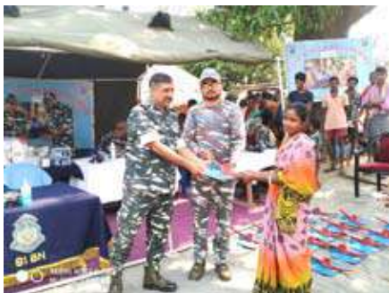
नागरिक सहायता कार्यक्रम का एक दृश्य।

केन्द्रीय रिजर्व पुलिस बल अपने तैनाती के क्षेत्रों में आम जनता को न केवल सुरक्षा प्रदान करता है बल्कि लोगों से भावनात्मक रूप से जुड़कर उनकी समस्याओं के निराकरण का प्रयास करता है। लगभग हर बटालियन नागरिक सहायता कार्यक्रम (CIVIC ACTION PROGRAMME) में आम लोगों को शैक्षणिक, कृषि उपकरण, दवाईयां, शुद्ध पेयजल, सौरलाईट इत्यादि उपकरण प्रदान कर लोगों के जीवन को आसान बनाने का प्रयास करती हैं। जम्मू व कश्मीर में "मददगार" एप टोल फ्री नं. 14411 से आम लोग अपनी समस्याओं में सीधे केन्द्रीय रिजर्व पुलिस बल से सहायता मांगते हैं तथा उनको त्वरित सहायता प्रदान की जाती है। कोरोना महामारी में केन्द्रीय रिजर्व पुलिस बल के कार्मिकों ने अपने वेतन से राशि इकट्ठा कर जरूरतमंद लोगों में अनाज वितरण किया जो मानवीयता के चरमोत्कर्ष को प्रदर्शित करता है।